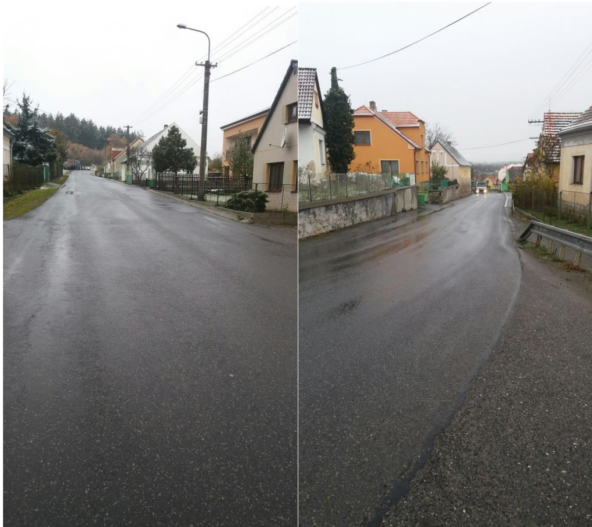
Obrázek 4 Aktuální stav komunikace na průjezdu obcí Albrechtice nad Vltavou – viditelné poruchy – trhliny ve vozovce, nezpevněná krajnice