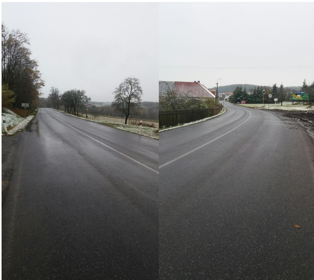
Obrázek 3 Aktuální stav komunikace v extravilánu a na počátku zástavby obce Albrechtice nad Vltavou – viditelné poruchy vozovky – nedostatečná šířka krajnice, nezpevněná krajnice