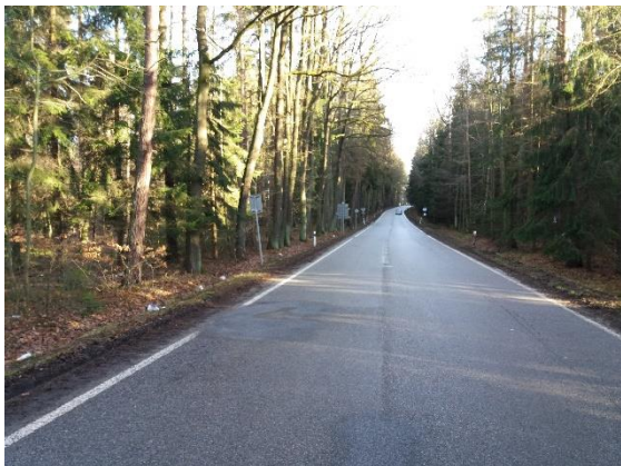
SO 105 km 7,257 – 7,650