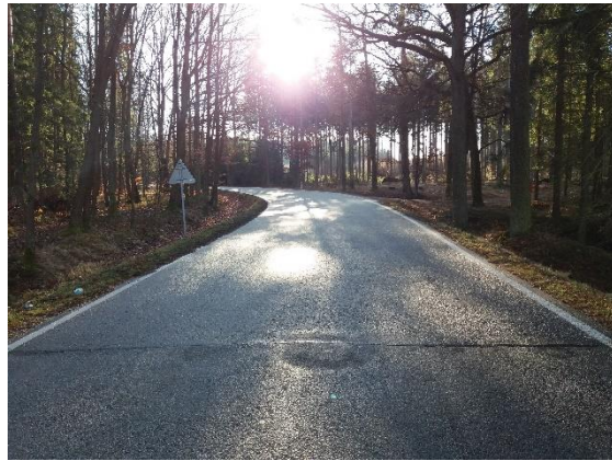
SO 104 km 6,400 – 7,190