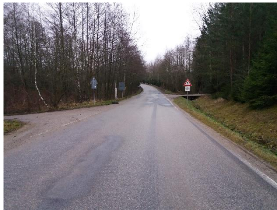
SO 106 km 67,920 – 8,480