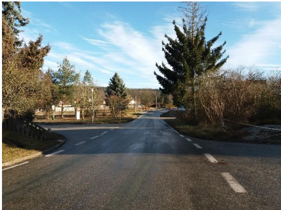
SO 103 km 2,583 – 2,700