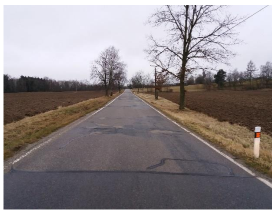
SO 108 km 16,682 – 17,623