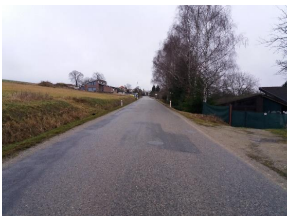
SO 107 km 78,480 – 9,600